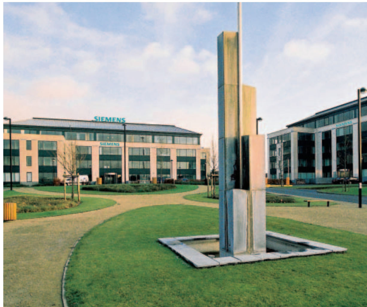
Siemens met aussi l'accent sur l'importance d'un cadre de travail agréable pour tous ses collaborateurs. ■ SIEMENS

Le portefeuille environnemental de Siemens s'oriente sur la transformation de toute la chaîne énergétique, par le biais d'initiatives pour la protection de l'environnement et du climat, et de technologies fiables pour la ges-